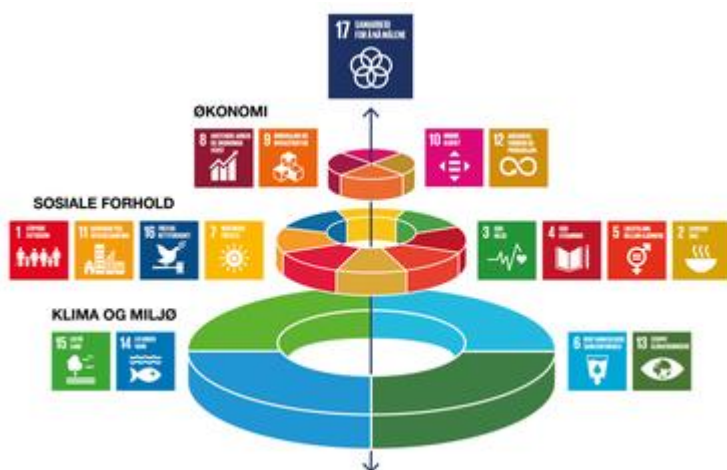
Figur: FNs 17 bærekraftsmål

Ifølge «Nasjonale forventninger til regional og kommunal planlegging» (av 14.05.2019) skal FNs bærekraftsmål ligge til grunn for all planlegging. Med utgangspunkt i disse forventningene vil Hamarøy kommune bruke den kommende prosessen med samfunnsdelen til å klarlegge nærmere hvilke av bærekraftsmålene som er viktigst for kommunen, og som følgelig bør få størst fokus i planarbeidet.