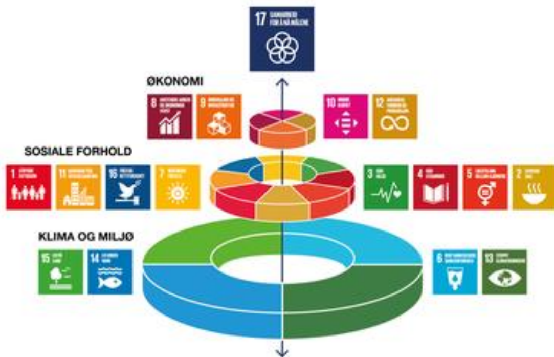
Figur: FNs 17 bærekraftsmål.

Hamarøy kommunes planstrategi 2020-24: Vedtatt 16. desember 2020 (sak 137/20).