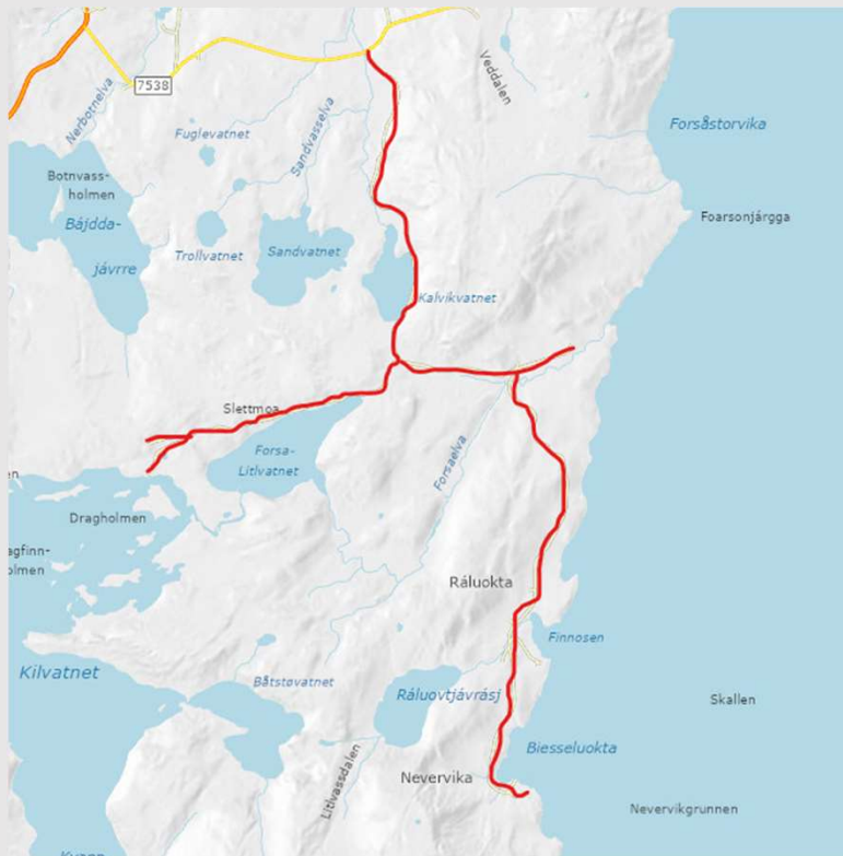
Forsåveien og Nevervikveien

Noen eksempler på veier / deler av veier som kan bli omklassifisert i h.t. foreslåtte kriterier. Oversikten er ikke uttømmende.