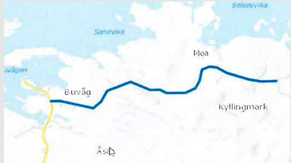
Kyllingmark (Vei 04)