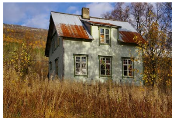
Sandnes skole i dag.

Den første skolen i Sagfjorden ble bygd på Sandnes gård i 1878. I 1916 ble det satt opp et tilbygg til skolen til internat.