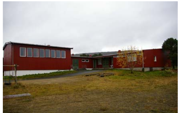
Den nye skolen på Helland