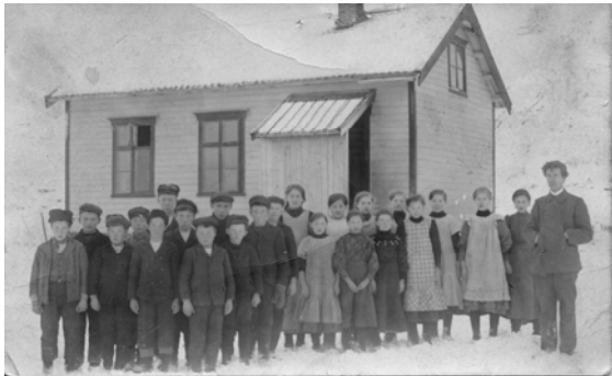
Stensland skole ca. 1905

Den første skolen på Stensland ble tatt i bruk i 1894. Det var et tømmerbygg som var det vanlige på den tiden. I 1933 ble skolehuset flyttet ca 100 m til Fagerbakken like ovenfor nåværende ungdomshus.