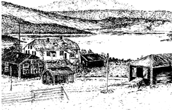
Den gamle prestegården på Presteid.

Den første skolen i Hamarøy ble bygd i 1807 i nærheten av kirken og prestegården på Presteid. Den gamle prestegården ses på tegningene. Ingen vet bestemt hvilket hus som var skole, men selve stedet så slik ut.