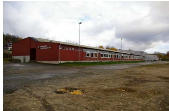
Ungdomsskolebygget i dag.

Allerede i febr.1961 godkjente skolestyret plan og kostnadsoverslag for ungdomsskolen. Denne ble tatt i bruk i januar 1966 og gav rom for både framhaldsskolen og realskolen. Undervisningen i ungdomsskolen kom i gang høsten 1967. Samme år ble det bestemt at skolen skulle hete Hamarøy sentralskole .