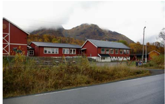
Skutvik skole i dag.

Skolen er flere ganger blitt utvidet. I 1967 ble navnet forandret til Skutvik skole .