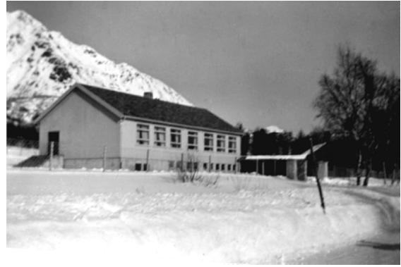
Steinsland skole fra 1953

I 1938 ble det vedtatt å bygge samleskole for Sørbygda, men på grunn av krigen 1940-45 ble bygginga utsatt. Strid om valg av skolested foregikk både før og etter krigen, men Steinsland ble til slutt det endelige valg. I 1952 kunne man endelig lyse byggearbeide ut på anbud. Den nye skolen ble tatt i bruk høsten 1953, men fikk ikke innlagt strøm før i januar 1955. Den gamle skolen utgjorde en del av byggematerialene i den nye.