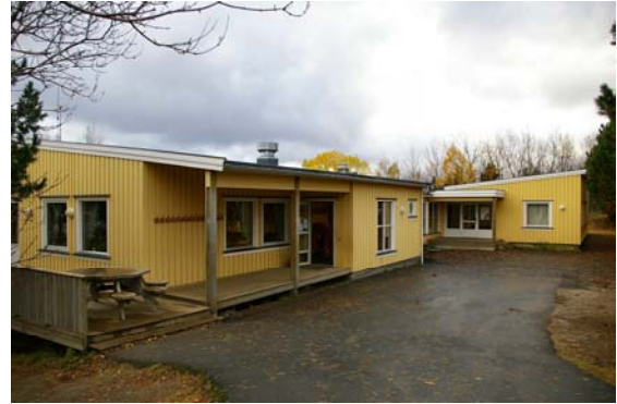
Barneskolen etter at den i senere år er blitt påbygd.

Høsten 1957 begynte planleggingen av ny skole, en samleskole, på Oppeid. Første byggetrinn, barneskolen, ble tatt i bruk høsten 1960.