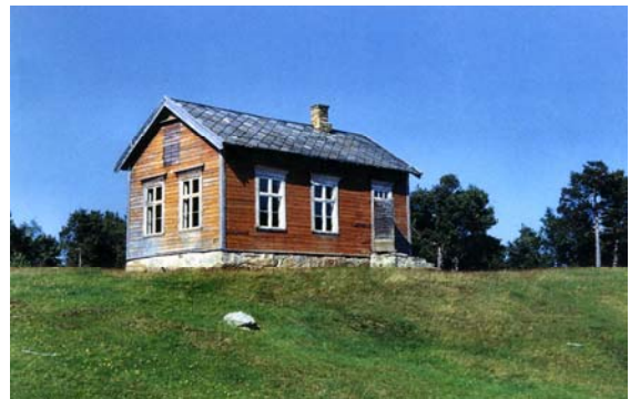
Den første skolen på Helland

I 1891 ble den første skolen bygd på Helland. I 1908 hadde muren under skolen seget så mye at det ble bestemt å flytte skolen til et sted med fastere grunn. Den ble flyttet ca. 20 m i nordlig retning, samtidig som bygningen ble dreid en halv gang rundt på grunn av lysforholdene. I 1925 ble loftet i skolen løftet en halv m for å få mer luft.