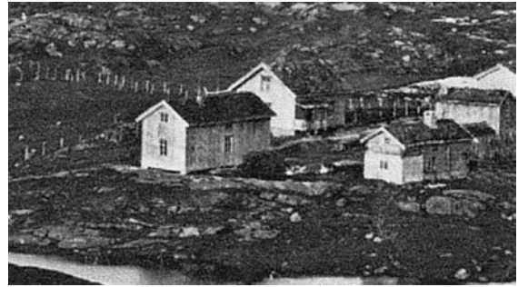
Huset i midten er Fikke gamle skole.