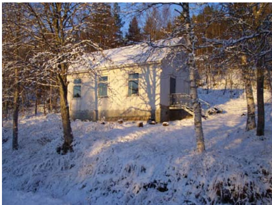
Vassbotn skole som grendehus i Skilvassbakk.