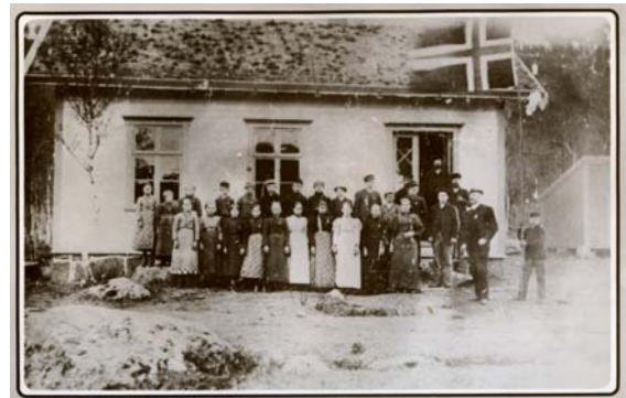
Røsvik skole fra ca. 1900.