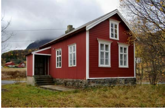
Hamsund skole. Skolemuseum.

overført til Hamarøy sentralskole på Oppeid. Samme år ble det bestemt at Hamsund gamle skole skulle være skolemuseum.