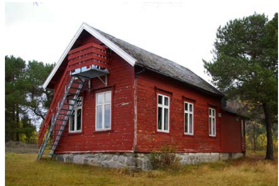
Ulvsvåg gamle skole

Den gamle skolen var i bruk til den nye sto ferdig i 1954. Skolen er blitt utvidet flere ganger, først i 1961 for å få plass til kontorer samt rom for vaktmester. I 1968 ble det vedtatt å bygge gymsal. Den gamle skolen brukes fremdeles etter behov.