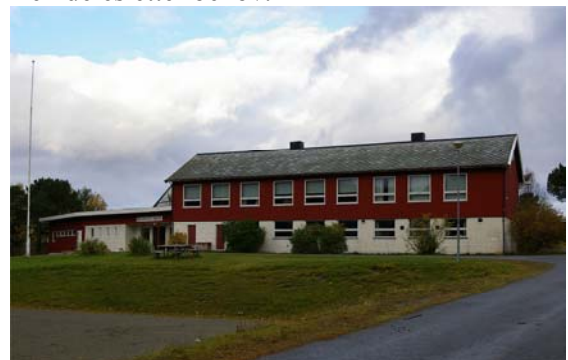
Ulvsvåg skole i dag

Den gamle skolen var i bruk til den nye sto ferdig i 1954. Skolen er blitt utvidet flere ganger, først i 1961 for å få plass til kontorer samt rom for vaktmester. I 1968 ble det vedtatt å bygge gymsal. Den gamle skolen brukes fremdeles etter behov.