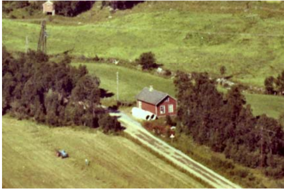
Luftfoto av Røsvik gamle skole.

seg nytt bolighus. Odd brukte sin del til garasje.