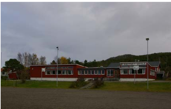
Innhavet skole i dag.