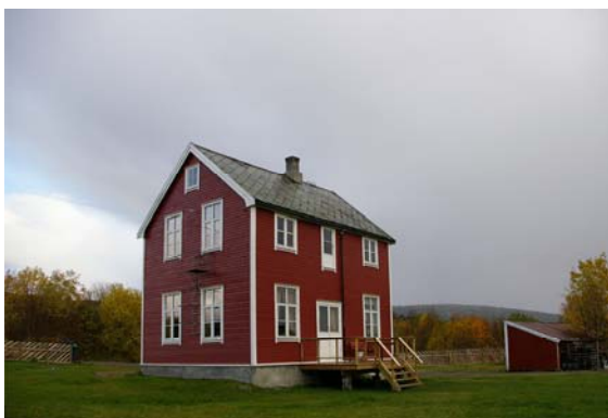
Finnøy skole i dag.