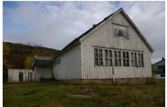
Fikke skole i dag