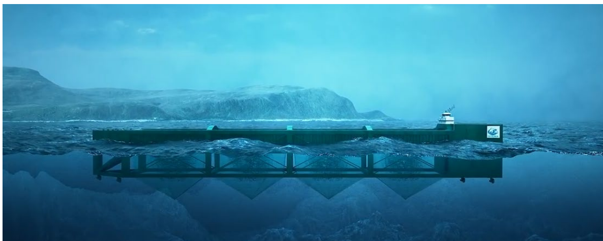
Foreløpig illustrasjon av Havfarm 2 (Nordlaks)

Endelig utforming og egenskaper knyttet til anlegget/fartøyet er ikke avklart, da Nordlaks ikke har mottatt alle formelle tildelinger fra Fiskeridirektoratet. Foreløpige tall: lengde 310 meter, bredde 63 meter, dybde i riss 42 meter.