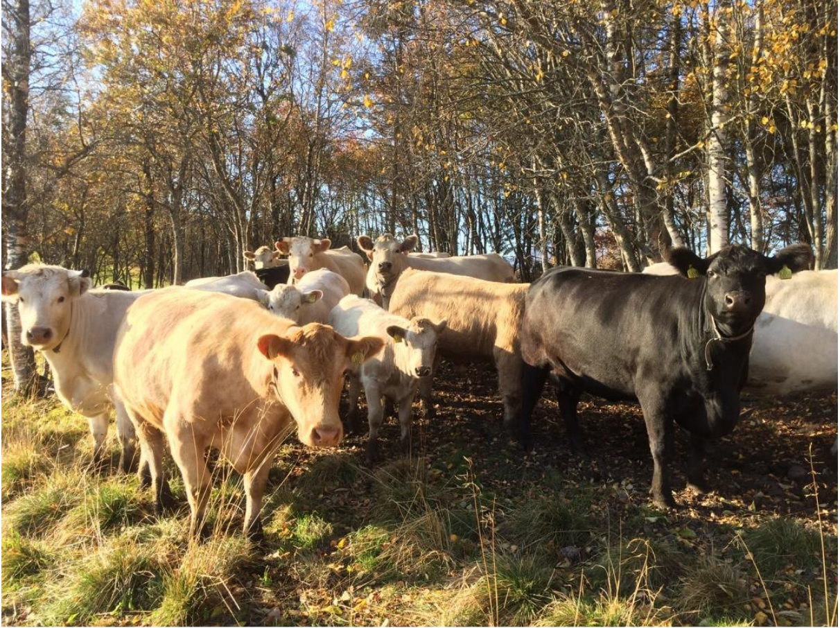
Kyr på beite-Uteid. Hamarøy