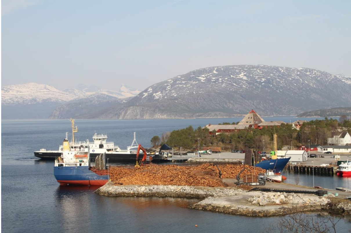
Utskiping av tømmer – Drag. Hamarøy

Tilskudd utbetales med inntil 60 % av godkjente merkostnader.