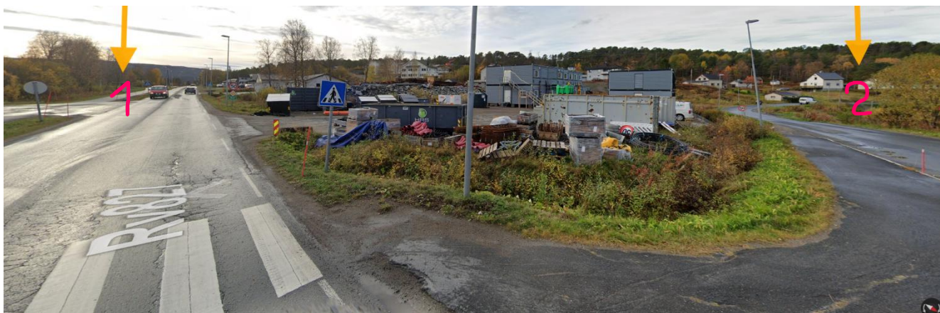
Figur 1 Gåavstand, 1 - Buollda boligfelt, 2 – skolen, trafiksikre gangforbindelser. Utklipp fra Googl kart

Detaljregulering PlanID 1875-202503 Utarbeidet av: Jana Kanstad, 04.09.2025