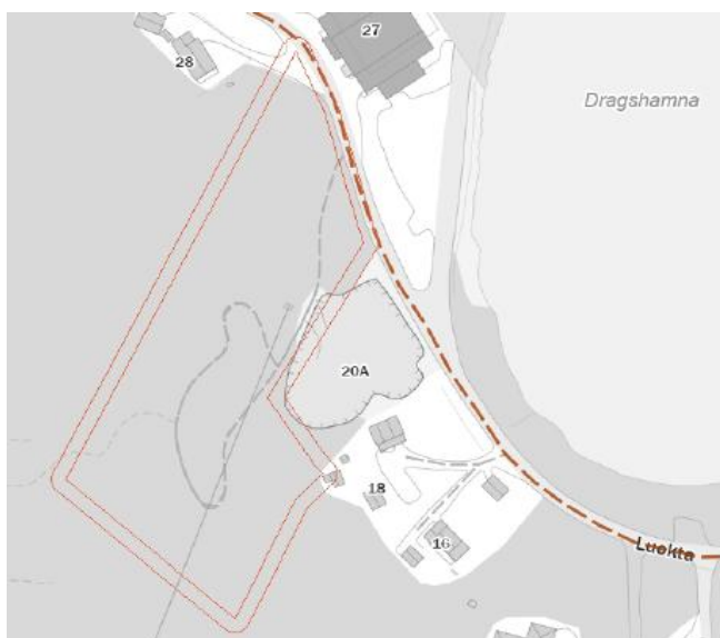
Figur 4 Sykkelveg. Utklipp fra DAK analyse, Turrutebasen