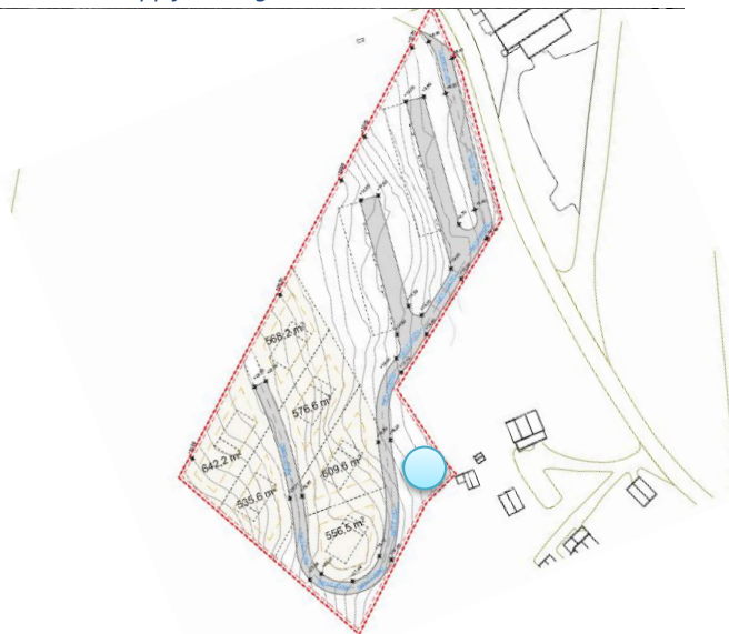
Figur 3 Utklipp fra arbeidstegninger, blå sirkel viser planlagt lekeplassplassering