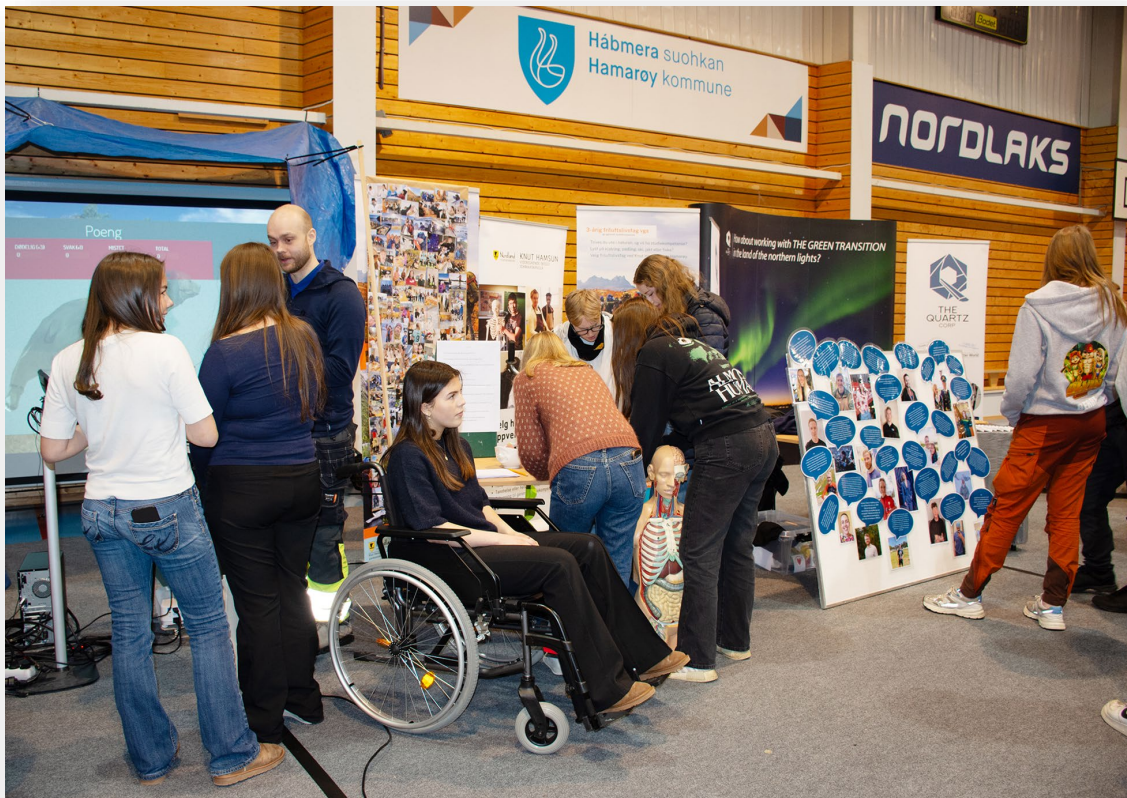
Knut Hamsun videregående skoles stand på Karrieredag 2024