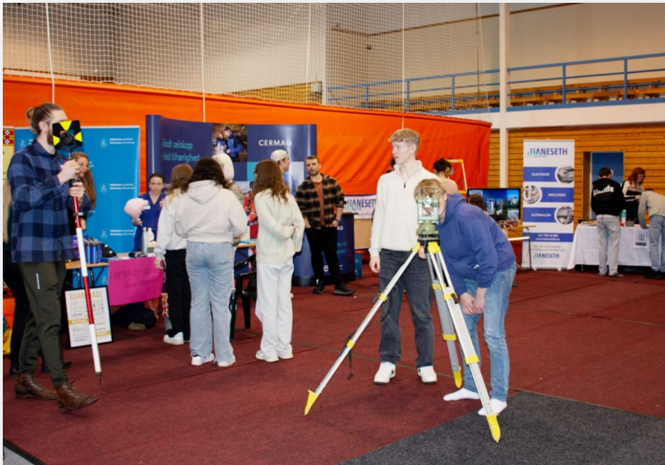
Karrieredag for kommunens ungdommer i 2024 – det lokale næringslivet stilte opp. Elever fra videregående skole er en viktig del av målgruppen for arrangementet.