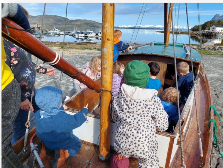
Ulvsvåg barnehage leker i båten sin.

Hábmera suohkan - Hamarøy kommune samarbeider om pedagogisk-psykologiske tjenester og barnevern med Bodø kommune, som er vertskommune for begge tjenestene (pr. 2025). Helse miljøtilsyn Salten IKS ivaretar barnehagemyndighetsoppgave i samarbeid med de andre Saltenkommunene (pr. 2025). Vi har et ansvar for å følge opp samarbeidene og bidra til at tjenester leveres til barnets beste.