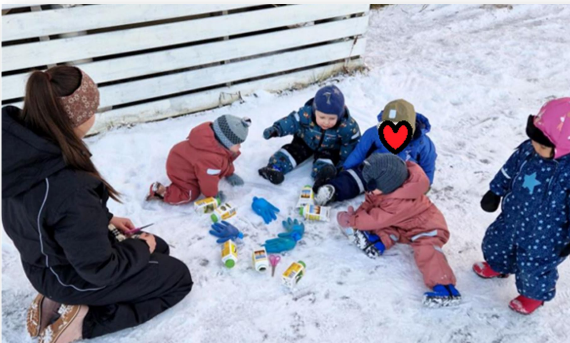
Innhavet barnehages småbarn lager isskulpturer i de samiske fargene