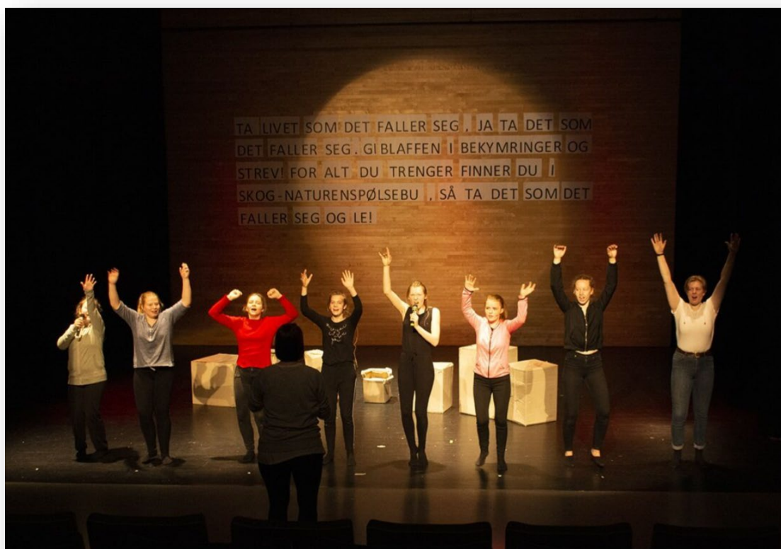
Teaterøving: Habmera suohkan - Hamarøy kommune har gode tilbud innen kreative aktiviteter, og ditto dyktige utøvere.