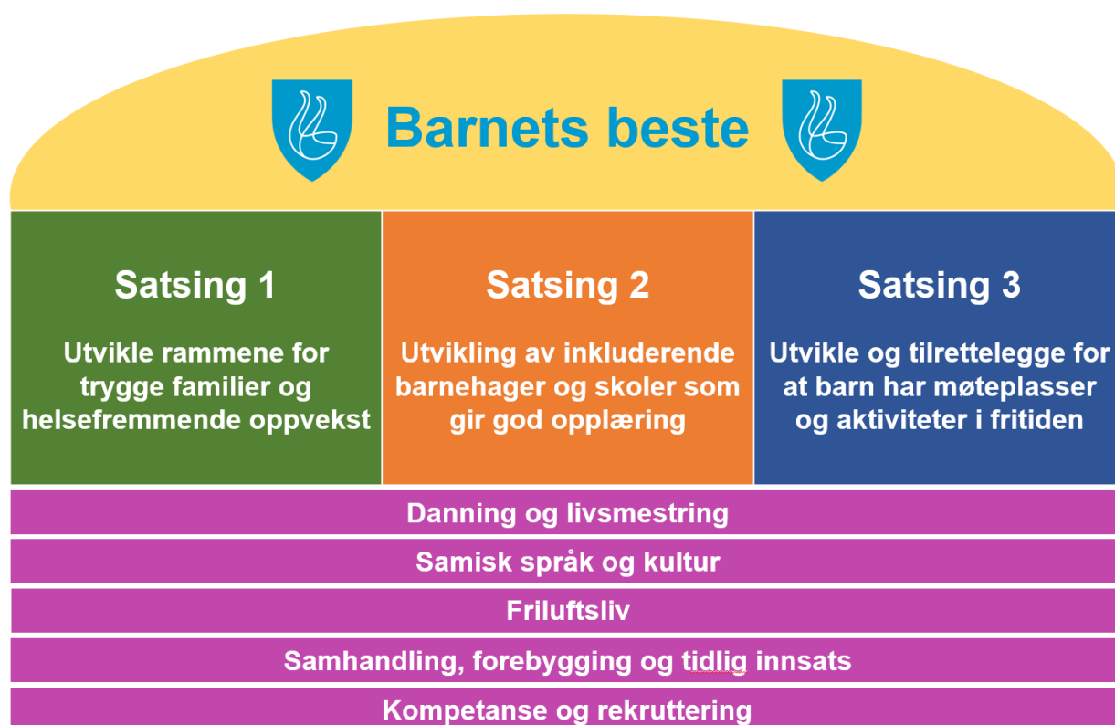
Figur som illustrerer hovedlinjene i oppvekstplanen vår.