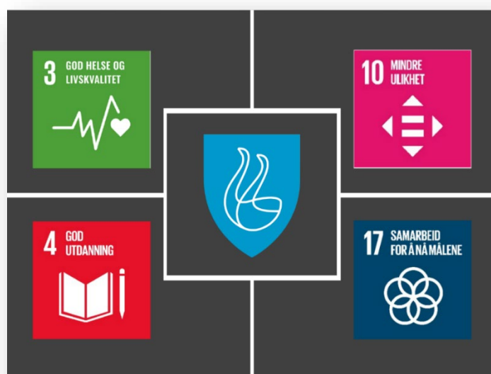
Figur: FNs bærekraftsmål som støttes av Hábmera suohkan - Hamarøy kommunedelplan for oppvekst 2025-2033

– Vi må motivere de unge til skolegang og deltakelse.