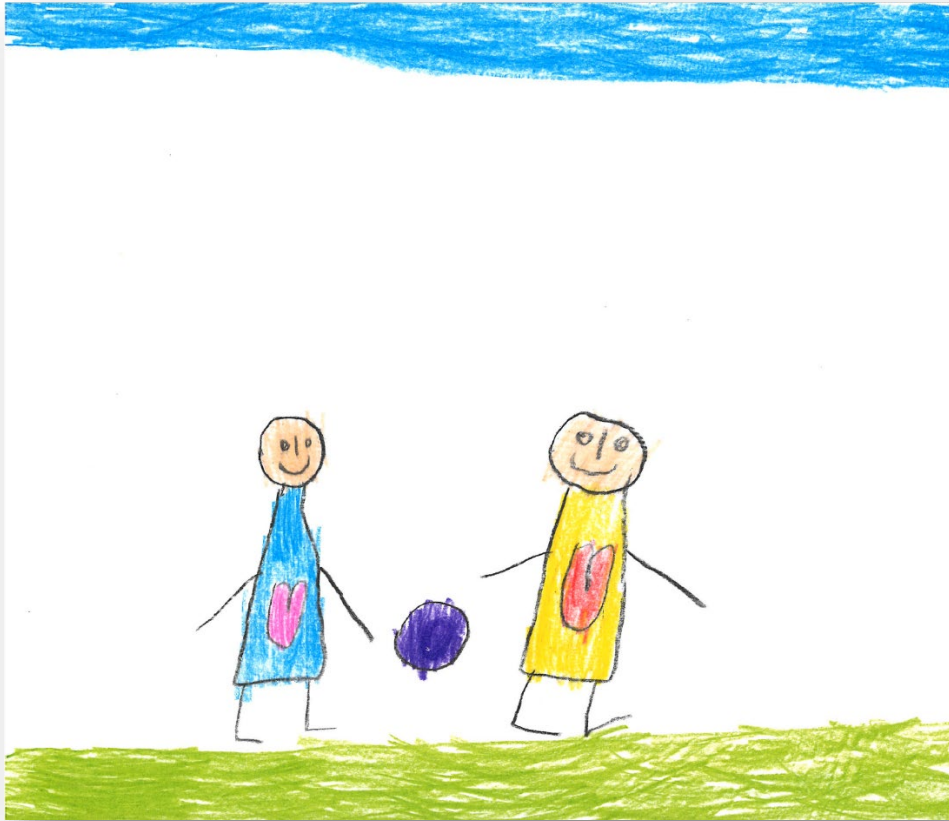
Barnetegning fra medvirkningen. Illustrerer den en drøm om at ukrainske barn skal få det trygt og godt her hos oss?