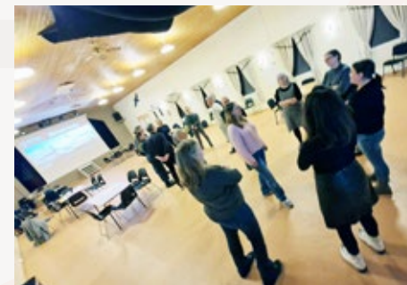
Under planprosessen ble møter, medvirkning og verksteder innledet med leker som passer godt for barn og voksne sammen. Her fra Drag/Helland samfunnshus og Hamsunsenteret.