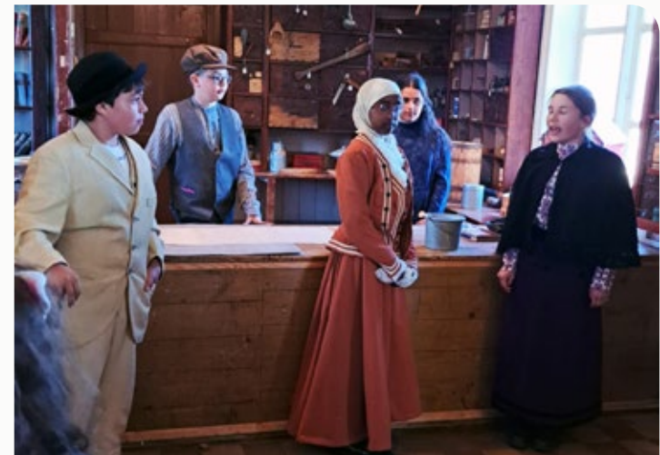
Teaterøving: Hábmera suohkan / Hamarøy kommune har gode tilbud innen kreative aktiviteter, og ditto dyktige utøvere. Her fra en oppsetning på Hamarøy bygdetun med Hamarøy kulturskoles dramagruppe.