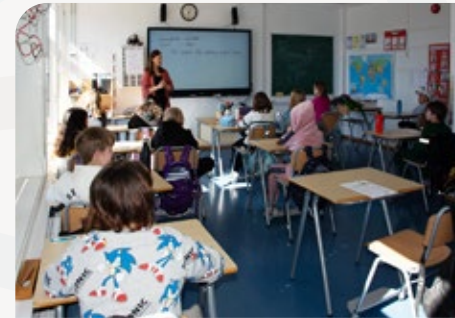
Skoleelever og barnehagebarn i hele kommunen ble involvert i arbeidet med oppvekstplanen. Medvirkningen var tilpasset barnas alder.

Arbeidet med denne oppvekstplanen pågikk i 2024 og 2025. I prosessen ble det lagt stor vekt på medvirkning, og hele befolkningen var invitert til å engasjere seg, skrive innspill og delta på møter.