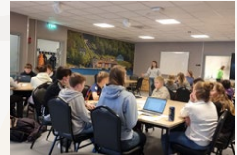
Tidens første elevkonferanse i Hamarøy ble avholdt 21. februar 2025. Tema var ny oppvekstplan. Elevrådene på alle skolene var samlet, og ungdomsrådet var arrangør.