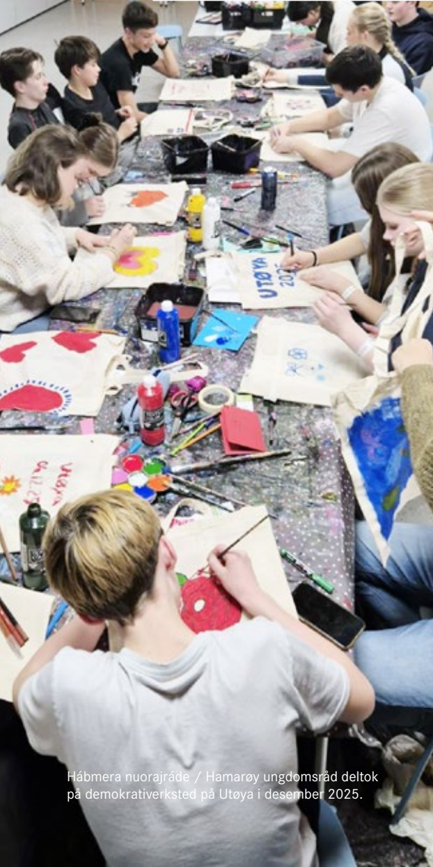
Hábmera nuorajráde / Hamarøy ungdomsråd deltok på demokrativerksted på Utøya i desember 2025.