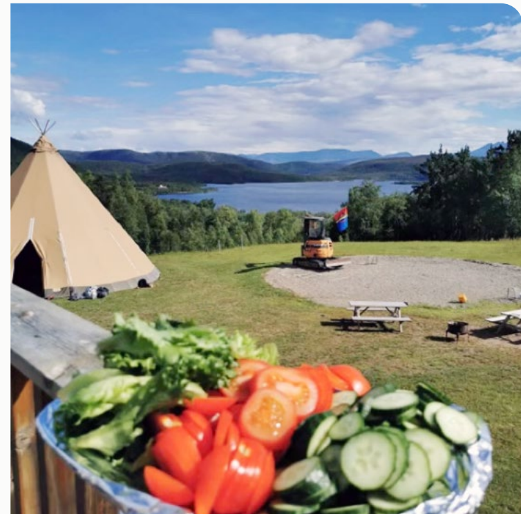
Hábmera suohkan / Hamarøy kommune, i samarbeid med Salten friluftsråd, har i flere år arrangert friluftsskole om sommeren for barn i alderen 10–13 år, med overnatting ved Stall Eivik.

Forsterket samarbeid og dialog mellom foresatte, pedagoger og ulike helsetjenester, vil styrke familienes evne til å ta gode valg for seg selv. Forsterket samhandling skal bidra til å forebygge utenforskap og tidlig fange opp og bistå sårbare barn og familier.