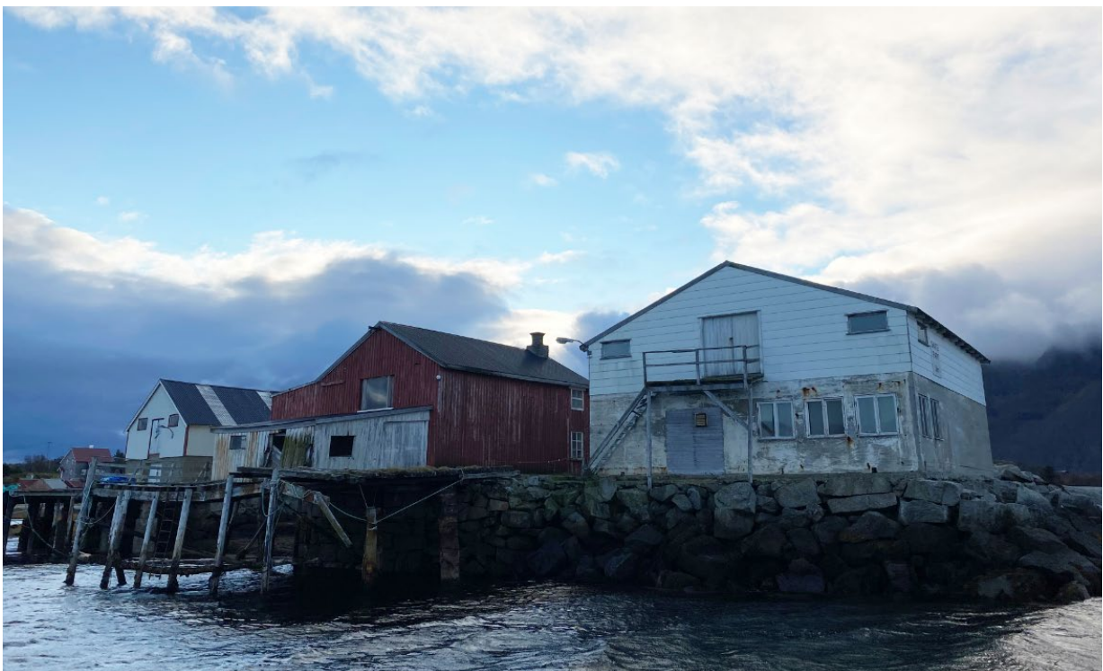
Eksisterende bebyggelse sett fra nordsiden/sjøsiden