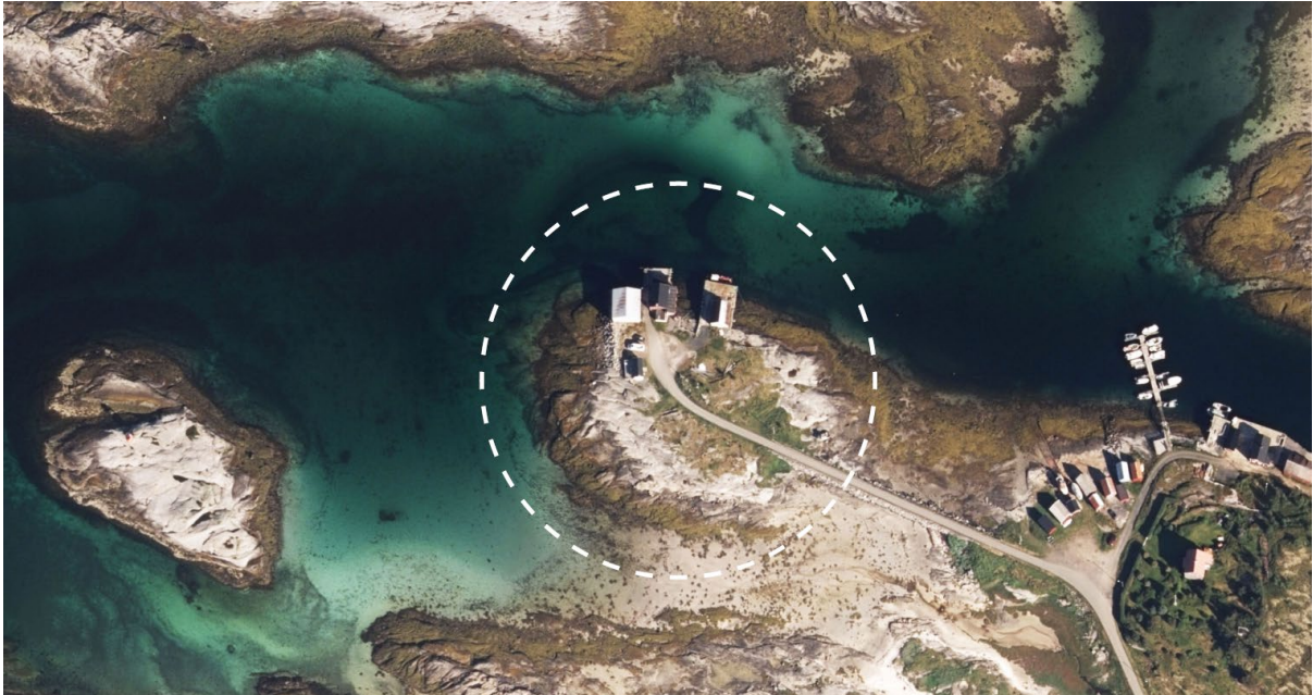
Planområdets beliggenhet i på Naustholmen i Buvåg

Planområdet omfatter Naustholmen i Buvåg med tilliggende arealer i sjø. Vegadkomsten fra øst er fylkesvei 7528 via en molo.