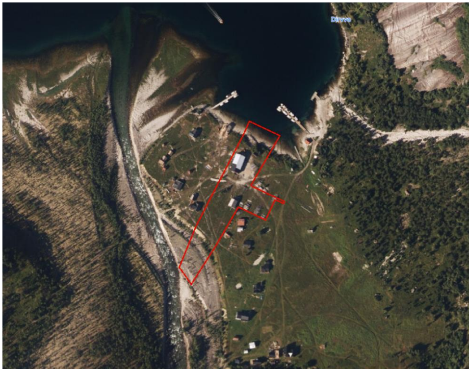
Figur 1 Oversiktskart