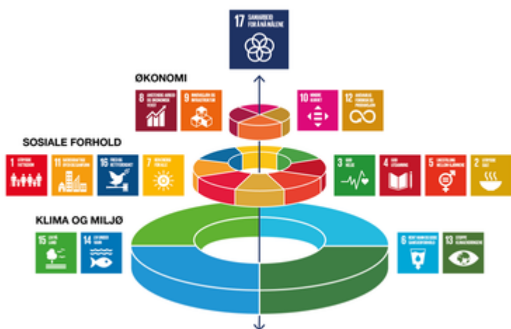
Figur: FNs 17 bærekraftsmål

Ifølge «Nasjonale forventninger til regional og kommunal planlegging» (av 14.05.2019) skal FNs bærekraftsmål ligge til grunn for all planlegging. Med utgangspunkt i disse forventningene vil Hamarøy kommune bruke den kommende prosessen med samfunnsdelen til å klarlegge nærmere hvilke av bærekraftsmålene som er viktigst for kommunen, og som følgelig bør få størst fokus i planarbeidet.